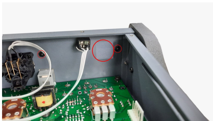
Imagen 2: Abertura para conector de la placa /CAM