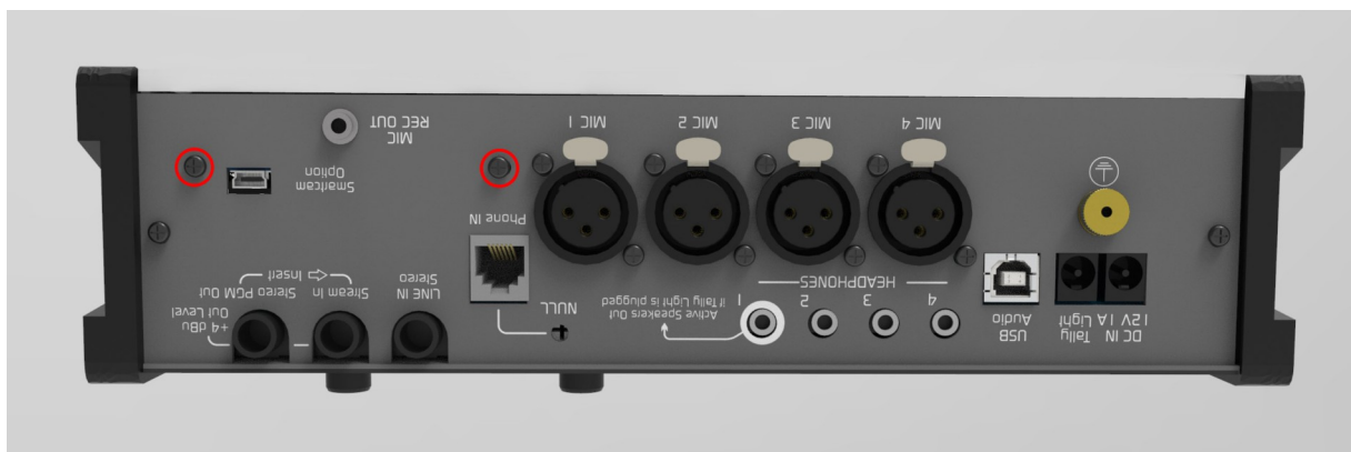
Imagen 4: Tornillos de sujeción placa SmartCAM