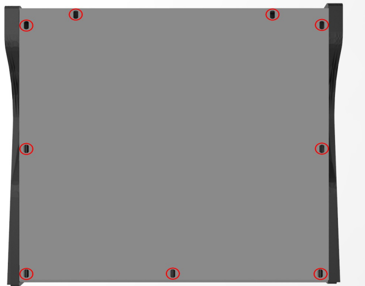
Imagen 1: Tornillos de sujeción tapa inferior